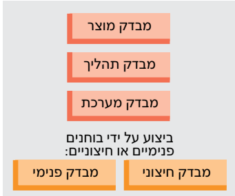
תמונה 1: סוגי מבדקים

המושג Audit בא מלטינית: audire = לשמוע. מבדק (אודיט) איכות הוא חקירה שיטתית ובלתי תלויה במטרה, לגלות מוקדי חולשה, ליזום שיפורים ולבחון את יעילותם. מבדקי איכות מבוצעים על פי תכנית על ידי בוחנים בלתי תלויים, שהוכשרו למשימה זאת. בתכנית המבדק רשום, מה, מתי, איך ואיפה בוחנים. חוברות חובה, שרטוטים, תקנים, תכניות בחינה, כרטיסי איסוף תקלות ורשימות תיוג משמשים כתיעוד. מבדילים בין מספר סוגי מבדקים, תלוי על מה יבוצעו מבדק ומי יבצע אותו (תמונה 1).