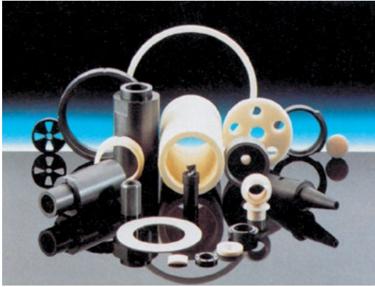
תמונה 1: רכיבים מחומרים קרמיים

חומרים קרמיים הם חומרים שאינם מתכתיים, או אורגניים, המיוצרים באמצעות שריפת חומר גלם אבקתי כבוש.