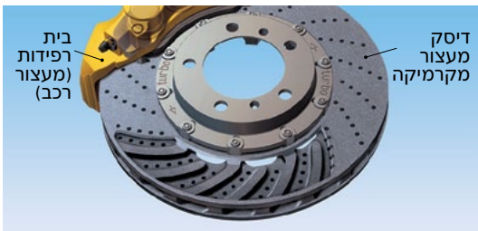
תמונה 2: דיסק מעצור (הספק גבוה) של מכונת ספורט

לחומרים קרמיים פרופיל תכונות משותף, המבדיל אותם במיוחד מהפלדות.