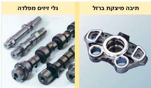
תמונה 2: חלקים מחומרים ברזליים

חומרי ברזל ליציקה, הם חומרים על בסיס ברזל הטובים ליציקה. יוצקים מהם רכיבי בניה, שעיצוב צורתם המסובכת הכי קלה באמצעות יציקה, לדוגמה תיבות (תמונה 2)