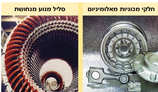
תמונה 3: רכיבים ממתכות אל ברזליות

מתכות קלות הן אלומיניום, מגנזיום וטיטניום. הם חומרים קלים, וחלקית בעלי חוזק רב. תחום שימושן העיקרי הוא לחלקים קלים, ליצור מכונות ומטוסים לדוגמה (תמונה 3).